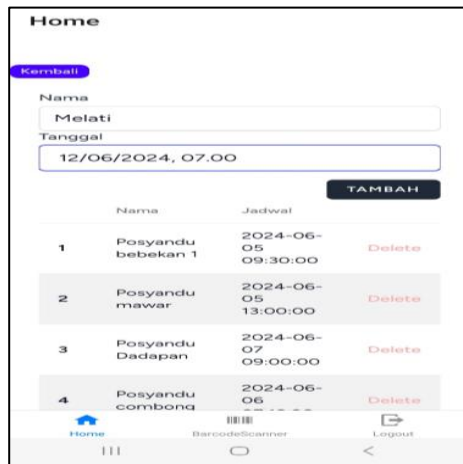
Gambar 3. Jadwal User Kader

dan dapat membuat akun kader, bidan, dan ibu balita.