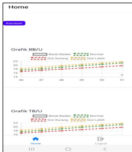
Gambar 4. User Ibu Balita

Pada tampilan kader terdapat menu profil, penjadwalan, dan daftar hadir. Kader bertanggung jawab untuk membuat jadwal pelaksanaan posyandu. Setelah melakukan penjadwalan, kader dapat melakukan scan barcode untuk menginput balita yang datang ke posyandu. Barcode atau qr didapatkan dari akun balita.