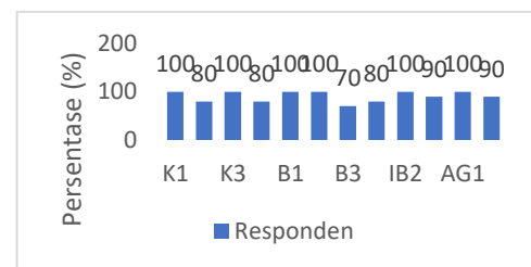
Gambar 5. Grafik penggunaan aplikasi SIGITA

Pada tampilan ibu balita mencakup data tentang data diri balita, grafik status gizi balita, serta qr balita. Ibu juga menerima notifikasi dari sistem. Notifikasi ini berkaitan dengan jadwal posyandu yang akan datang. Ibu balita juga memiliki akses ke barcode atau qr yang terkait dengan Nomor Induk Kependudukan (NIK) anak. Selanjutnya penilaian status gizi balita disajikan dalam bentuk grafik. Sama halnya dengan buku KMS, grafik ini mencakup 4 indeks yaitu: BB/U, PB/U atau TB/U, BB/PB atau BB/TB, dan IMT/U.