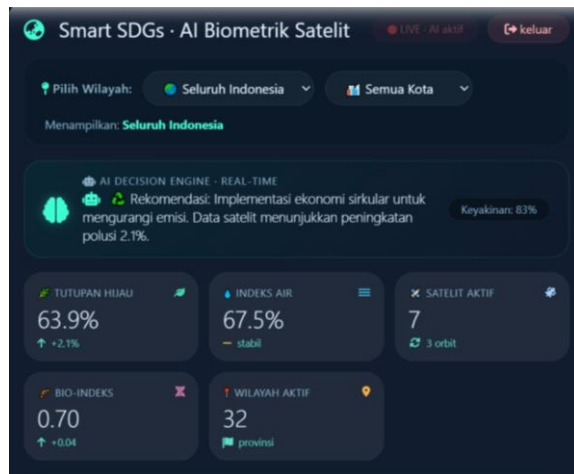
Gambar 2. Dashboard informasi data Smart SDGs

menunjukkan bahwa desain responsif meningkatkan aksesibilitas dan kepuasan pengguna, terutama bagi pengguna yang mengakses sistem melalui perangkat mobile di lapangan (Krug, 2023). Layout yang adaptif memastikan elemen-elemen login seperti ikon, judul, kolom input, dan tombol tetap proporsional dan mudah diinteraksikan di berbagai ukuran layar, mendukung kebutuhan pemangku kepentingan yang mungkin mengakses dashboard dari lokasi yang berbeda-beda, termasuk di daerah dengan keterbatasan infrastruktur teknologi (Nielsen, 2023; Garrett, 2024).